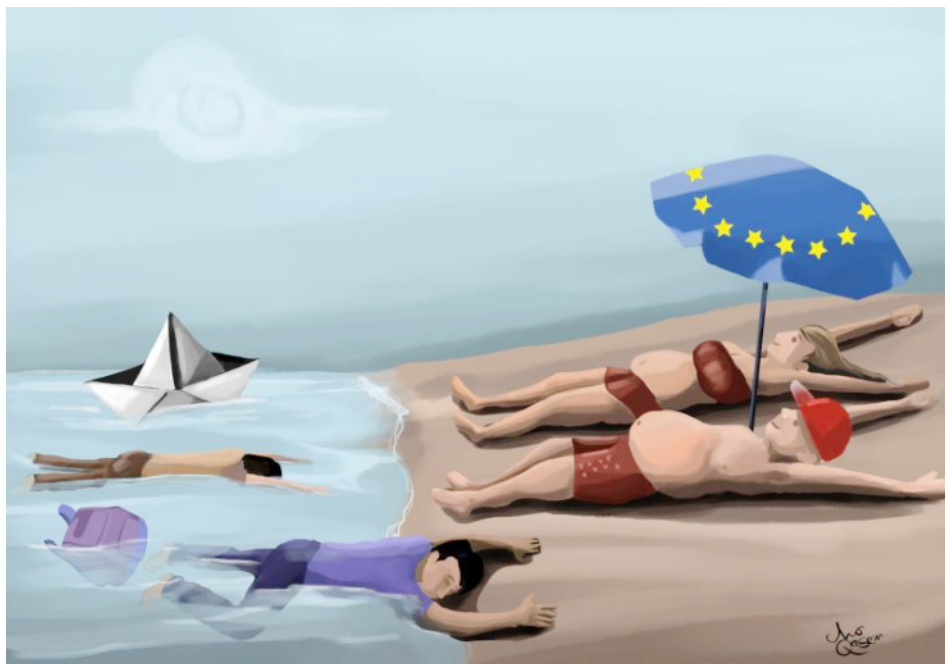
On beach Mo Qasem